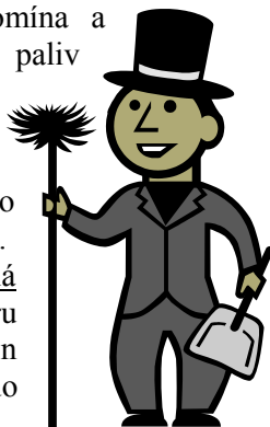
Lhůty kontrol a čištění spalinové cesty a spotřebiče paliv

Toto nařízení nabývá účinnosti dnem 1. ledna 2011.